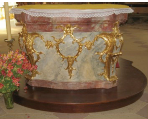
Fotografie: Damaris Muhlbach, 2010.