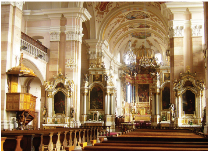
Fotografie: Damaris Muhlbach, 2010.

11 >>> Wie ist die Kirche verziert (= dekoriert)? Im Barockkunststil.