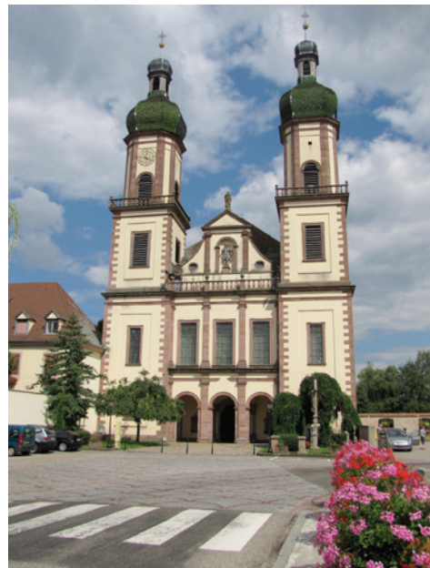
Fotografie: Rh-67, 2007. Lizenz: GNU.

1 >>> Wo befindet sich die Kirche von Ebersmünster? (In welcher Umgebung?) Erkläre warum.