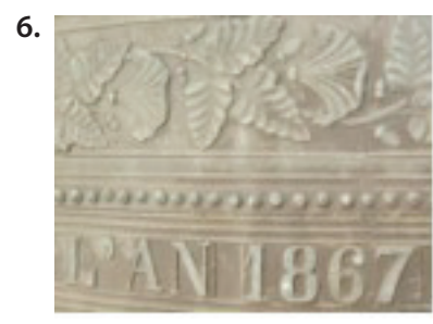
Fotografien: Damaris Muhlbach (1, 3, 4, 5 & 6) - Rh-67, 2007 (2)