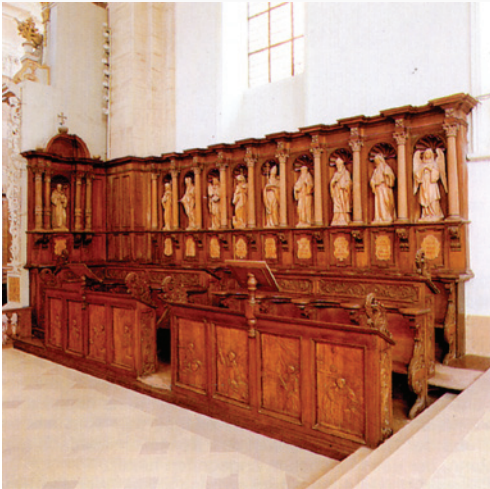
Abtei- und Pfarrkirche Ebersmünster. Regensburg: Schnell & Steiner GMBH, 2003, S. 10.