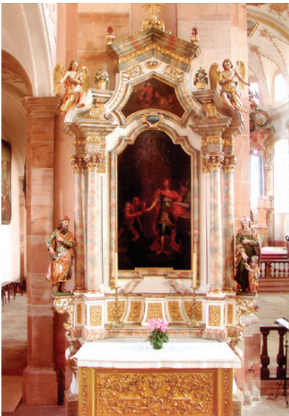
Fotografie: Damaris Muhlbach, 2010.

17 >>> Warum kann man sagen, dass eine solche Anordnung den Geist der Gegenreformation offenbart? (Was ist in dieser Anordnung wichtig?) Die Kirche ist in einem großartigen und reichen Kunststil gebaut um die Menschenmengen zu beeindrucken.