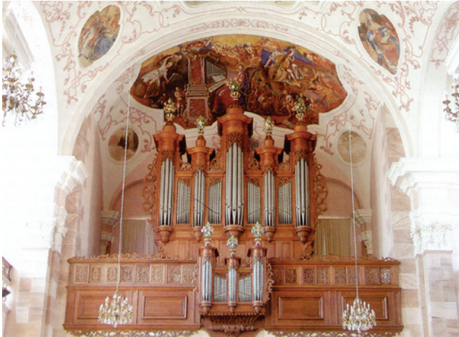
Abtei- und Pfarrkirche Ebersmünster. Regensburg: Schnell & Steiner GMBH, 2003, S. 11.

Sie ist eines der letzten Werke des berühmten Orgelbauers Andreas Silbermann. Ihr Bau wurde 1730 begonnen und zwei Jahre später fertiggestellt.