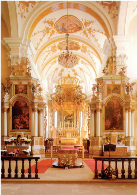
Abtei- und Pfarrkirche Ebersmünster. Regensburg: Schnell & Steiner GMBH, 2003, S. 7.

Dieses Monumentalwerk bildet den Konvergenzpunkt* der Raumperspektive. Auf dem Säulengang ruht eine Krone und auf der Tabernakeltür ist der auferstandene* Jesus abgebildet.