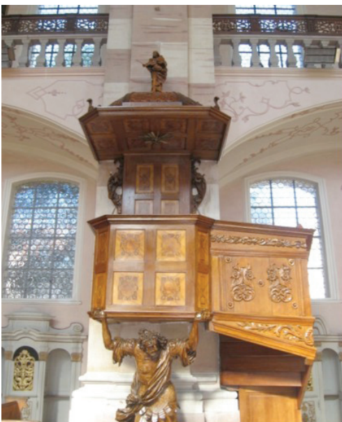
Fotografie: Damaris Muhlbach, 2010.