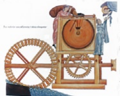
© Editions COPRUX - 67000 Strasbourg