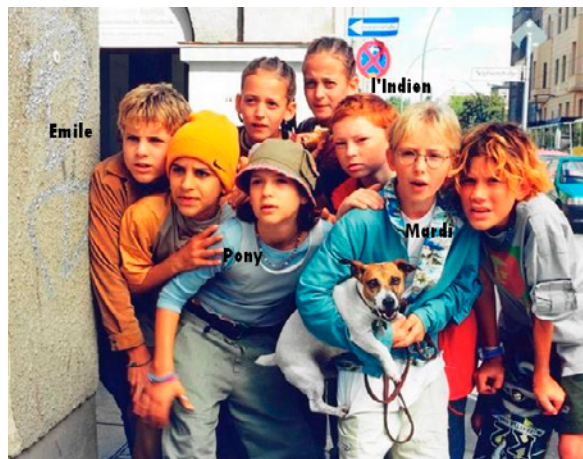
Image 1: « Emil und die Detektive » de Robert Adolf Stemmle (1954)