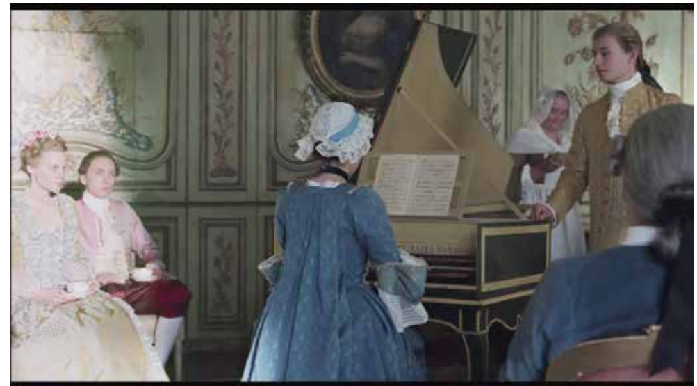
Photogramme 3 (00:05:26)