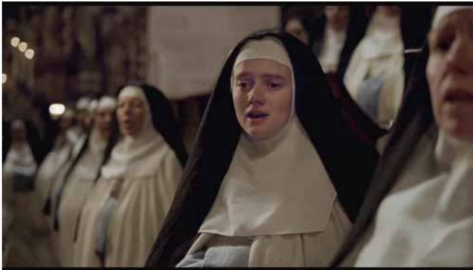
Photogramme 7 (00:58:21)

La jeune femme, incluse dans le chœur, s'en dissocie par le son, comme si son individualité ne pouvait être contenue, étouffée. Cette place à part est enfin visuellement prise en compte à Saint-Eutrope : le chœur s'organise autour d'elle, lui accordant la position centrale (Photogrammes 7 et 8), montrant ainsi qu'elle y est mieux respectée dans son originalité, mais marquant aussi la préférence accordée par la Mère Supérieure ; mais à Sainte-Marie, seul le son vient souligner cette volonté d'émancipation de la jeune femme par rapport à ses coreligionnaires.