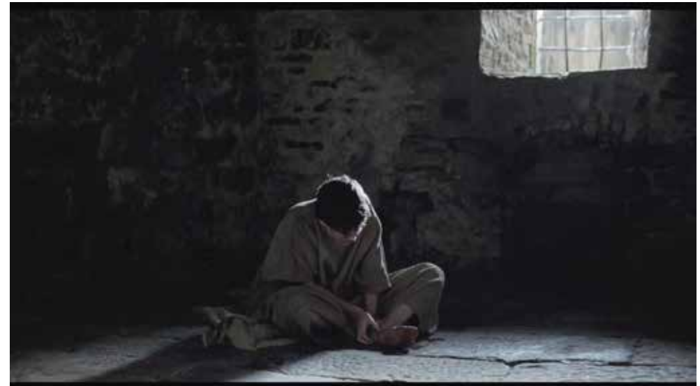
Photogramme 5 (05:26)