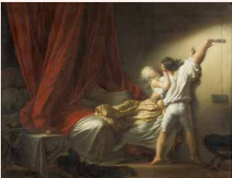
Document 10 - Jean-Honoré Nicolas Fragonard, Le Verrou (vers 1777)