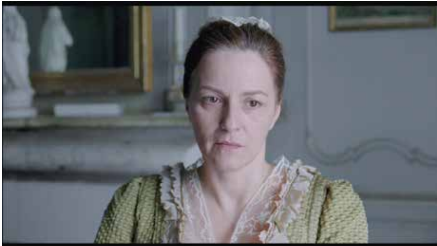
Photogramme 9 (La mère de Suzanne)