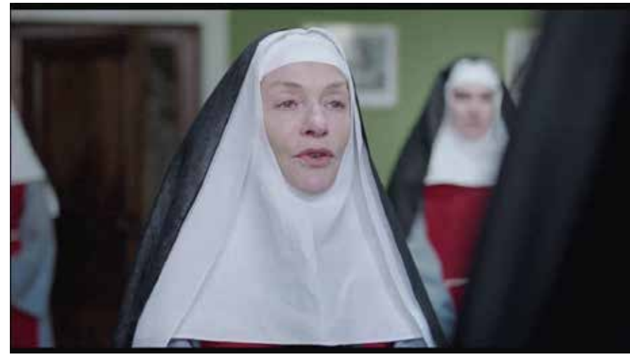
Photogramme 12 (La Mère supérieure de Saint-Eutrope)