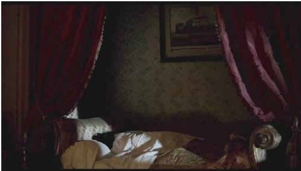
Photogramme 2 (00:02:05)

Par ailleurs, le rôle de la narratrice et de sa voix singulière est rendu par l'omniprésence de la jeune femme à l'image ; on notera en outre que la caméra nous fait entrer dès le début du film dans son intimité, ses pensées : la première séquence du film la montre de dos, endormie, sans défense, innocente ( Photogramme 2 ), puis, au début du récit rétrospectif, toujours de dos, à l'épinette ( Photogramme 3 ) ; la caméra se rapproche peu à peu, la contourne, nous découvrant son visage, enfin, mimant ainsi une plongée dans son intériorité.