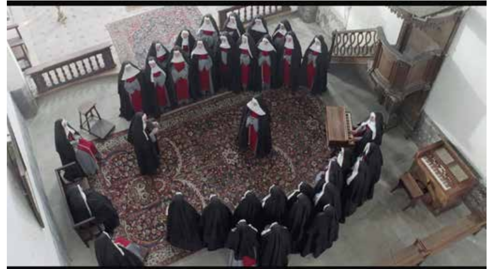
Photogramme 8 (01:22:56)

Cet aspect, particulièrement réussi dans le film de Guillaume Nicloux, est l'un des premiers indices de la prise de parole à venir de Suzanne, de la demande de libération enfin assumée, d'abord par écrit, puis face à Sœur Christine et au prélat chargé de la juger. Cette parole orale, dans un premier temps indomptée (faute de maîtrise de soi et de ses mots, la jeune femme passe pour hystérique aux yeux de sœur Christine, qui en profite pour la déclarer possédée ; et elle répond un « j'suis pas possédée » fort peu formel au prélat lors de son interrogatoire), deviendra aussi, petit à petit, par sa parcimonie et sa modération, un signe de la maturité de Suzanne.