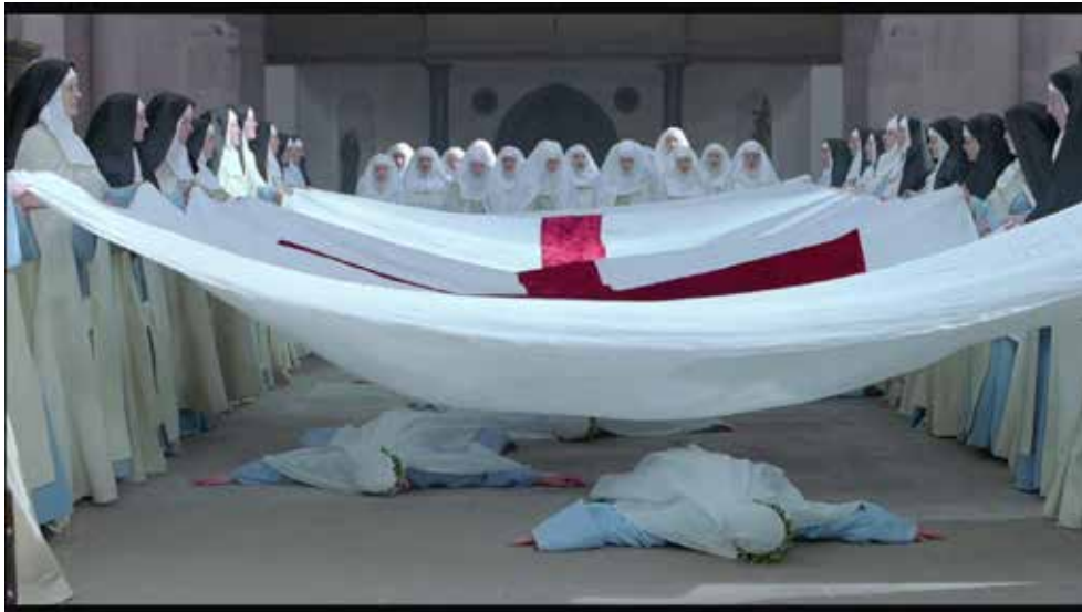
Photogramme 6 (00:18:33)

Dans un premier temps, la révolte de Suzanne apparaît comme purement viscérale ; si elle refuse de prononcer ses vœux lors de la première cérémonie, cela semble être sous l'impulsion du moment, un refus instinctif de la condition à laquelle on la condamne – alors que dans le roman, elle a envisagé ce refus, l'a planifié (Document 3). La cérémonie elle-même est d'ailleurs beaucoup plus détaillée que dans le roman, et d'autant plus marquante : les sœurs prosternées, face contre terre, et recouvertes lentement d'un voile blanc évoquant un linceul, semblent mourir symboliquement au moment où elles entrent en religion (Photogramme 6) ; les claquements qui rythment la vie religieuse (au réfectoire comme lors de cette cérémonie) illustrent la violence de la contrainte qui s'exerce sur ces jeunes femmes. Guillaume Nicloux nous fait ainsi sentir, entendre, voir, ce que perçoit Suzanne ; le refus qu'elle oppose à cette violence est avant tout un refus des sens, corporel, brut, qui se manifeste d'abord par le silence ; il n'est pas le fruit d'un discours rationnel, mais d'un instinct, que le réalisateur a voulu nous transmettre par cette scène toute en intensité.