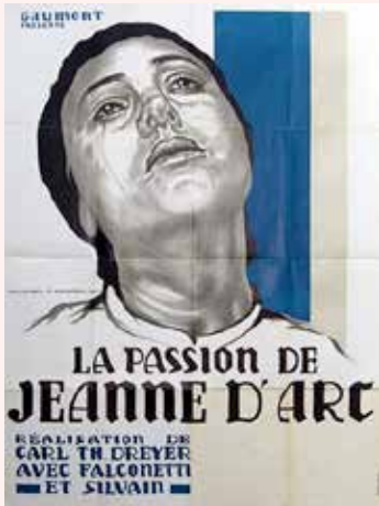
Document 4. Carl Theodor Dreyer, La Passion de Jeanne d'Arc (1928)