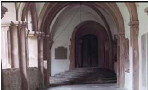
Photogramme 13 (00:58:21)

Dans le film, ce premier visage est bien présent, brièvement (Suzanne parle alors, comme dans le roman, du « cours de séduction très subtil » qui lui est fait pour la persuader de prendre le voile (Folio classique p. 52, Garnier Flammarion p.18). Mais cette impression est ensuite balayée par l'attention, la douceur, que Madame de Moni accorde à Suzanne : elle la reçoit, console ses larmes, la rassure (« C'est très beau, de pleurer » lui dit-elle), et essaye de l'accompagner dans son engagement par ses conseils et ses prières (elle engage ainsi l'ensemble des religieuses à prier avec elle pour Suzanne). Elle incarne donc une forme de sagesse, de bonté, de foi mystique et pure, qui en font la seule Mère Supérieure positive de l'œuvre, ainsi que le seul modèle maternel dans lequel Suzanne peut trouver un soutien aimant ; Guillaume Nicloux est en cela très fidèle au roman —un bon exemple de cette relation transparaît dans les pages 78-80 (Folio Classique ; Garnier Flammarion p.40-43) de l'œuvre.