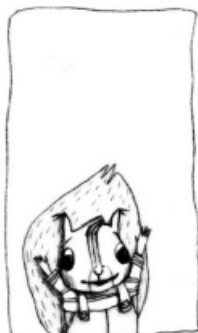
Max ist 2 Jahre alt.