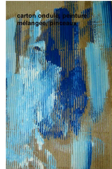
carton ondulé, peinture mélangée, pinceaux