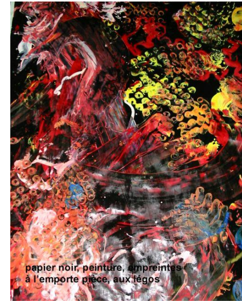
papier noir, peinture, empreintes à l'emporte pièce, aux légos

Objets détournés : jeux (petites voitures), emporte pièces.