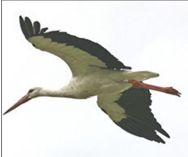
Cigogne en plein vol

Autrefois, la migration des cigognes marquait la ronde des saisons. Leur départ, en août, pour les pays d'Afrique au sud du Sahara, annonçait l'approche de la mauvaise saison. Aussi, c'est avec impatience que les villageois guettaient leur retour après un rude hiver! Lorsqu'elles réapparaissaient en mars, ils étaient sûrs que le printemps était proche.