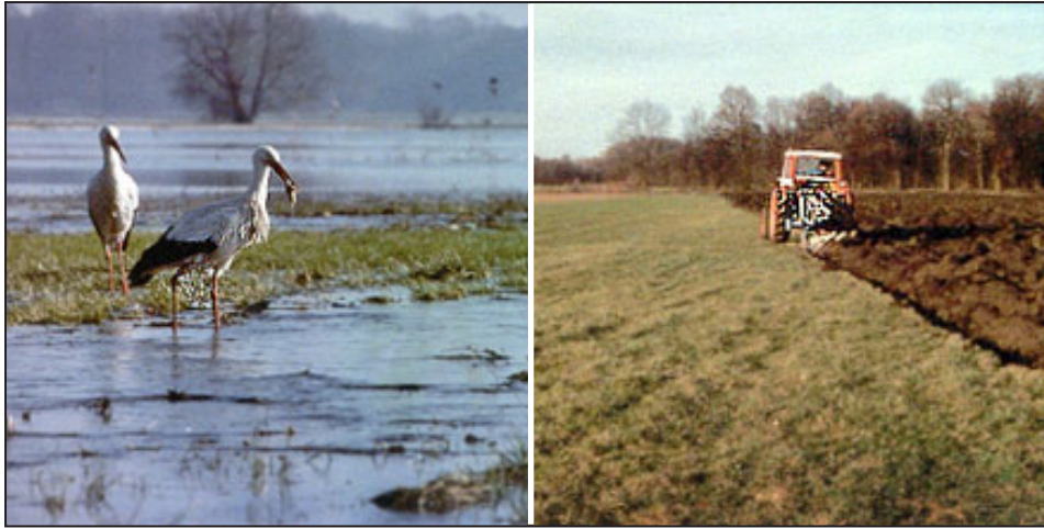
Deux paysages du Ried