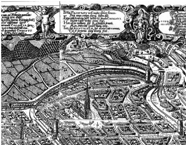
Freiburg i. B. plan de Georgius Sickingner