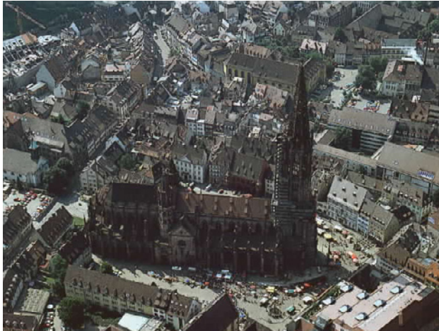
Freiburg i. B.

Du haut du clocher de la cathédrale , on voit bien la topographie de la ville médiévale. Freiburg in Breisgau a été fondée en 1120 par les Ducs de Zähringen à qui l'on doit aussi les villes de Bern (CH), Fribourg (CH) et Villigen (D).