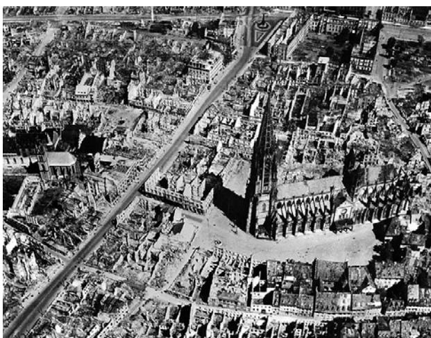
Freiburg i. B.