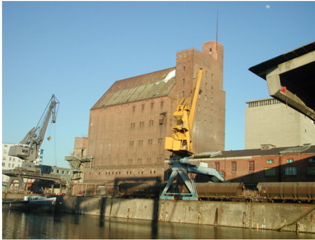
Der Basler Siloturm

Bevor du dich auf den Weg machst, um auf die Plattform des alten Getreidesilos in Basel (CH) zu steigen, sollst du dir ein Bild von den Veränderungen machen, wie sie sich im Rheintal ergeben haben.