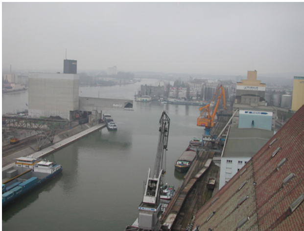
Siloturm, Blick aufs Rheintal Richtung Norden