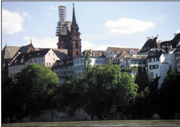
Blick auf Großbasel

Im Oberrheinraum gibt es eine Reihe von Sehenswürdigkeiten oder Veranstaltungen, die man gerne einmal besuchen möchte: