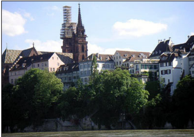
Blick auf Großbasel

L'espace du Rhin supérieur offre un grand nombre de curiosités, de lieux à visiter et de manifestations intéressantes. En voici quelques-uns :