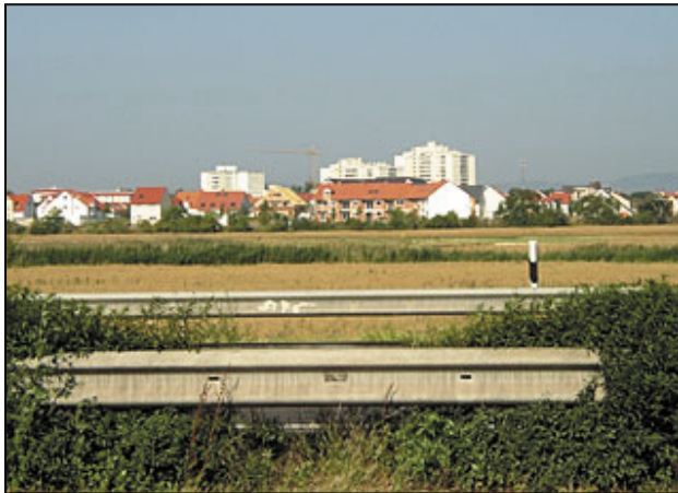
Verschiedenen Gebäudearchitekturen