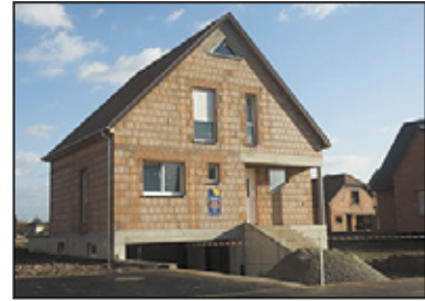
Neues Einfamilienhaus vor dem Verputzen