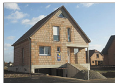
Maison récente avant crépissage