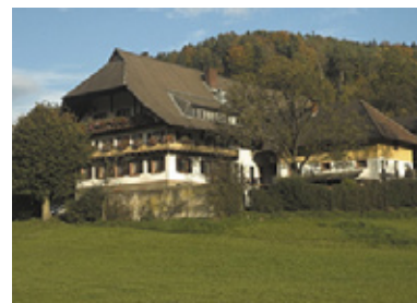
Maison traditionnelle à Nordrach (D)