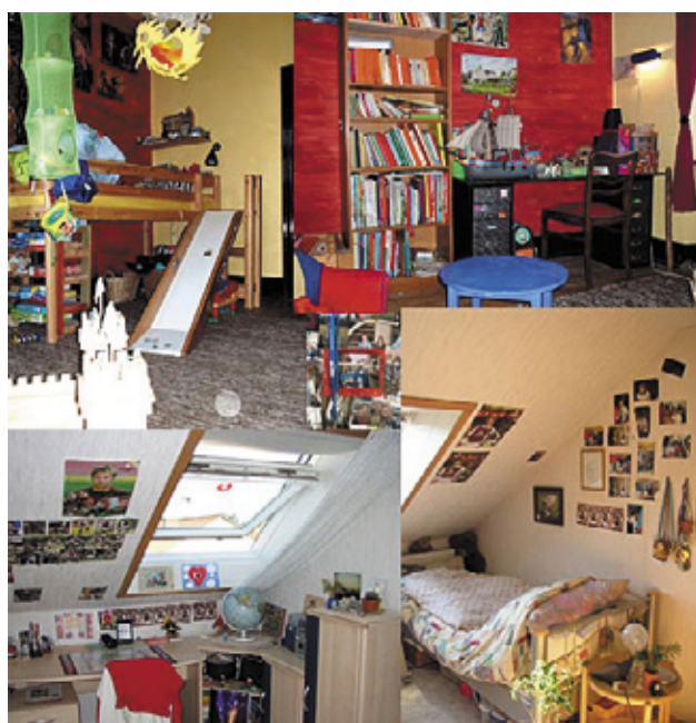
Chambres d'enfants et d'adolescents