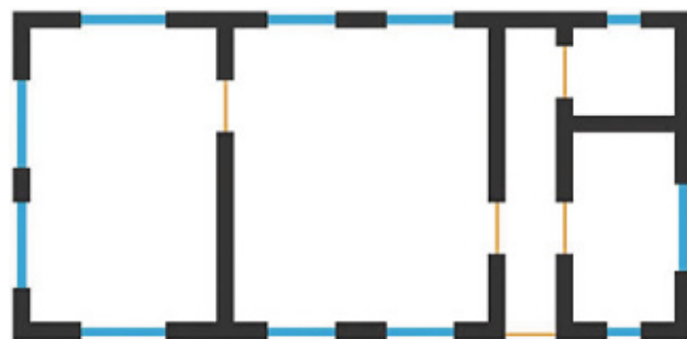
Plan d'appartement Dessin G.Tosca (LMZ RP)