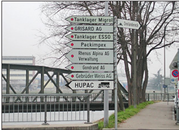
Signalisation d'entreprises dans une zone industrielle