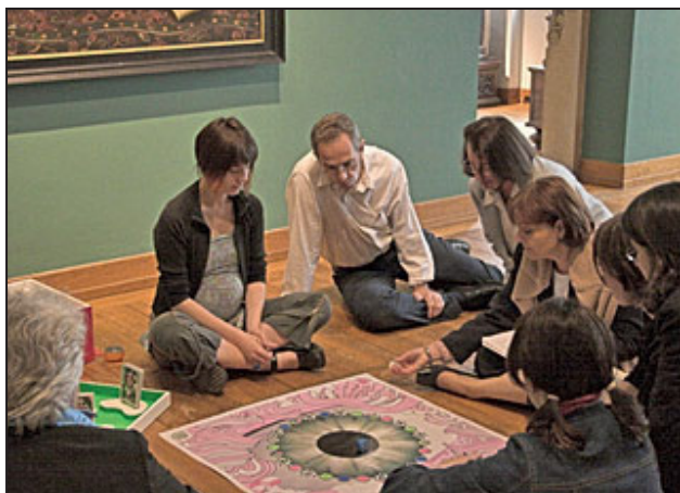
Un nouveau regard sur le musée

Parmi les 650 musées de la région, tu peux visiter d'étonnantes musées à thèmes, comme le "Musée de la grenouille" à Münchenstein (CH), le "Musée du papier peint" à Rixheim (F) ou le "Oberrheinisches Narrenmuseum" à Kenzingen (D).