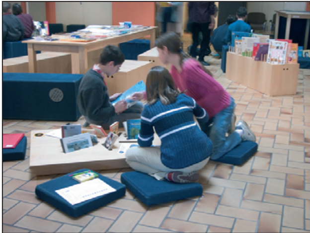
Activités pédagogiques lors d'une exposition