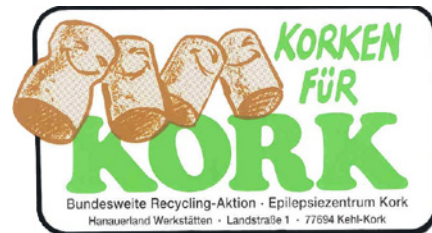
Korken für Kork

L'industrie, le commerce et l'artisanat essaient aussi de contribuer à la protection de l'environnement. Les communes de Basel-Landschaft et de Basel-Stadt ont organisé en 1997 un concours visant à récompenser le "produit Regio" de l'année. Les lauréats furent : une entreprise de Therwill (Basel-Landschaft) pour sa brosse à dents multi-têtes, l'atelier de carrosserie Drücktech (Basel-Landschaft) qui n'emploie ni peinture, ni laque et le producteur de lait Milchhüsli (Basel-Landschaft) pour son concept de production de lait de la région pour la région.