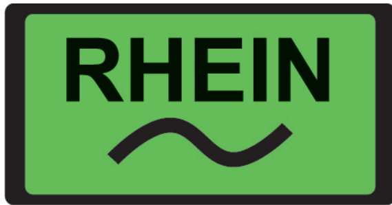
Panneau "Le Rhin"

Les ministres de l'environnement des pays qui bordent le Rhin ont pris des décisions politiques importantes. En adoptant le "Programme Rhénan 2020", ils se sont prononcés pour des améliorations conséquentes de l'écosystème du Rhin qui seront réalisées dans les prochaines années. Ces directives trouvent leur écho dans les exigences de l'Union Européenne concernant la qualité de l'eau.