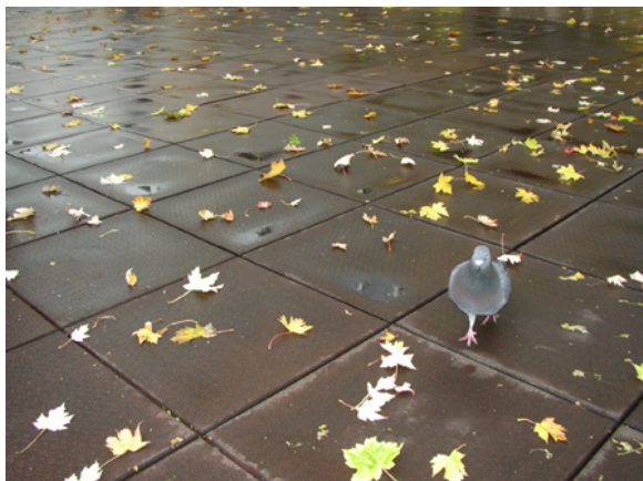
Revêtement de sol fait de pneus recyclés

Dans l'espace du Rhin supérieur, il existe de nombreux exemples de coopération transfrontalière dans le domaine de l'environnement. Les communes du Palatinat du sud (Berg, Scheibhardt, Neulauterburg) et les communes alsaciennes voisines se sont groupées en syndicat intercommunal pour le traitement des eaux usées. À partir de 1999, les ordures du Landkreis Lörrach (D) seront incinérées à Basel. Lörrach prendra à charge les résidus incombustibles.