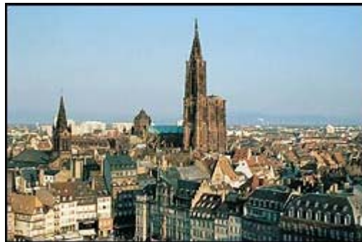
Strasbourg, vue d'ensemble