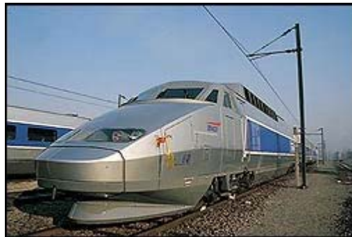
Le TGV dans les ateliers de maintenance de Bischheim

Confronter les points de vue des acteurs institutionnels nationaux et régionaux, et même des associations. Etude de textes.