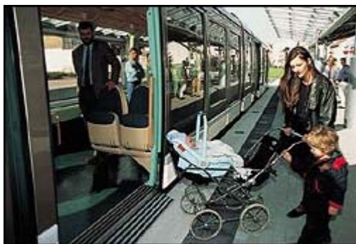
Le tram, élément majeur du Plan de Déplacement Urbain

Comprendre les enjeux du développement des métropoles. Mettre en évidence une stratégie de maîtrise des effets induits par la métropolisation dans une région fragile.