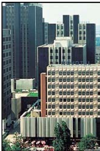
Centre commercial de la Place des Halles