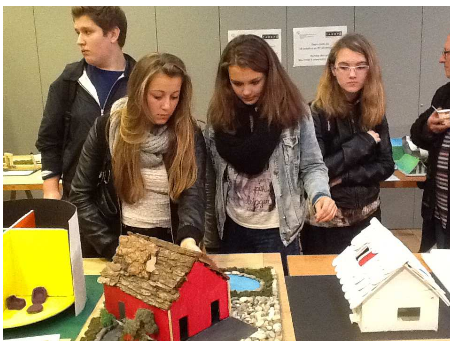
Exposition à Strasbourg – concours élèves 2014

La remise des prix aura lieu le 28 novembre à 11h00 à CANOPÉ en présence des membres du jury (architectes et professeurs) et des élèves. Les lauréats présentent leurs travaux autour d'un buffet et répondent à toutes vos questions !