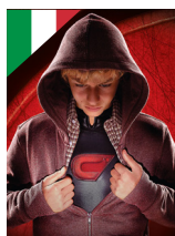
LE GARÇON INVISIBLE ITALIEN de Gabriele Salvatores