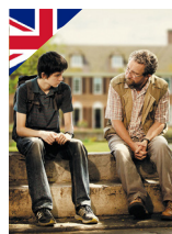
LE MONDE DE NATHAN BRITANNIQUE de Morgan Matthews