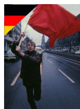
UNE JEUNESSE ALLEMANDE ALLEMAND de Jean-Gabriel Périot

Voyagez avec vos élèves le temps d'une projection en VO !