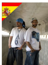
ESTO ES LO QUE HAY ESPAGNOL de Léa Rinaldi

pour les élèves du cycle 3 à la terminale