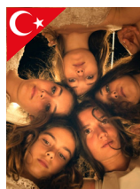
MUSTANG TURC de Deniz Gamze Ergüven