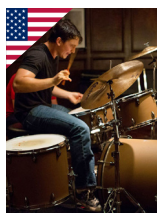
WHIPLASH AMÉRICAIN de Damien Chazelle