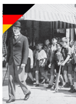
ÉMILE ET LES DÉTECTIVES ALLEMAND de Gerhardt Lamprecht